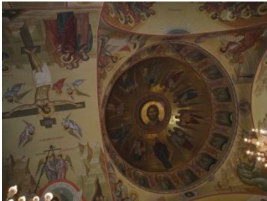
Рис. 4. Роспись купола храма

В храме установлен трехъярусный резной, позолоченный иконостас. Третий ярус представлен тремя иконами, обрамленными крупными арками, центральная икона, завершающая композиционную ось царских врат, выше и крупнее боковых икон. Форма царских врат имитирует воинский орден, в котором от иконы «Благовещение» расходятся золотые лучи плотным фоном, на котором по четырем углам расположены иконы евангелистов, как обрамление из драгоценных камней.