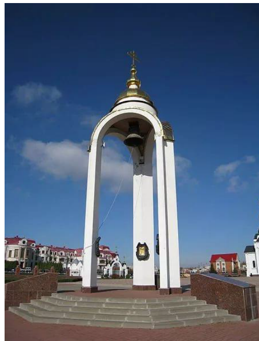
Рис. 6. «Колокол Единения»

Белгородского и Старооскольского Иоанна и губернатора Белгородской области Е.С. Савченко. На каждом пилоне ротонды изображения святых, которые особо почитаются тремя славянскими народами: образ святого равноапостольного великого князя Владимира, Преподобного Сергия Радонежского и преподобной Евфросинии Полоцкой [2]. Сам колокол был отлит в Москве, а по его верхнему поясу начертаны слова Преподобного Сергия Радонежского: «Любовию и единением спасемся». 3 мая 2000 года после Божественной литургии в храме Святых первоверховных апостолов Петра и Павла «Колокол Единения» славянских народов освятил Святейший Патриарх Московский и всея Руси Алексей II в присутствии президентов России, Украины и Белоруссии: В.В. Путина, Л.Д. Кучмы и А.Г. Лукашенко.