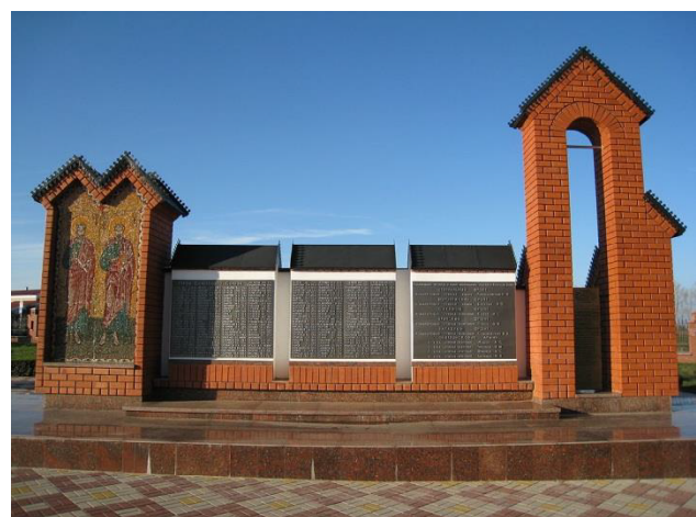
Рис. 7. Памятная стена