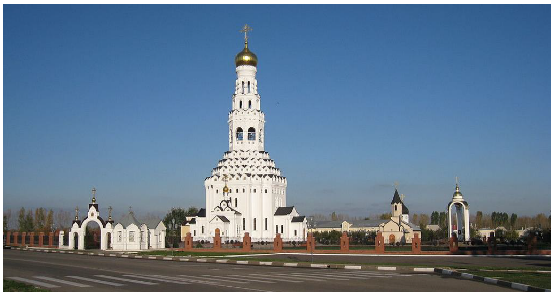
Рис. 1. Общий вид на храмовый комплекс

треугольными фронтончиками, третий ярус, завершающий вертикальную композицию, украшен в простенках бусами и многопрофильными фризом и карнизом барабана, над которым возвышается луковичная глава. Пространственно-планировочная структура здания представляет собой симметричный крестообразный план, в центре которого расположен четверик храма, все стороны которого обстроены равными по площади приделами, притворами алтарем. Приделы и алтарь сообщаются с храмом через арочные проемы. В храме устроены три входа, как указано на Святую Троицу: с западной стороны (это главный вход), с северной и южной сторон. Четверик храм перекрыт сомкнутым сводом, за которым скрыта галерея, ведущая на колокольню.