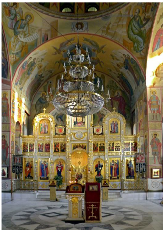
Рис. 5. Храмовый иконостас

«Колокол Единения», расположенный в южной части храмового комплекса, недалеко от храма во имя святых апостолов Петра и Павла, представляет собой ротонду на трех пилонах-опорах, перекрытую сводом, в центре которого висит колокол. Ротонда была возведена по инициативе митрополита (в то время архиепископа)