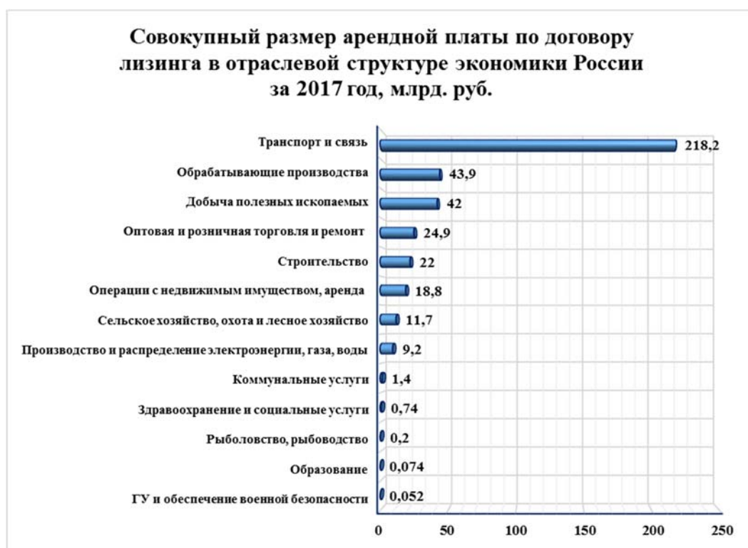
Рис. 1. Совокупный размер арендной платы по договору лизинга в отраслевой структуре экономики России за 2017 г., млрд руб. [9]

В отраслевой структуре экономики России наибольший размер арендной платы по договору лизинга наблюдается в сегментах транспорта и связи, обрабатывающих производств и добычи полезных ископаемых, что обусловлено необходимостью обновления основных фондов в соответствующих отраслях и высокой стоимостью оборудования (рис. 1). Среди основных фондов наибольшим спросом пользуются железнодорожная техника, авиационный, грузовой транспорт, легковые автомобили, суда. На транспортные сегменты приходится около 80%, строительную технику – 4,5%, сельскохозяйственную технику – 3,4%, машиностроительное оборудование – 3,1%, недвижимость и оборудование для газо- и нефтедобычи – 1,7% лизингового портфеля [2; 14]. Такое соотношение связано со строительством объектов инфраструктуры, ростом пассажирских и грузовых перевозок.