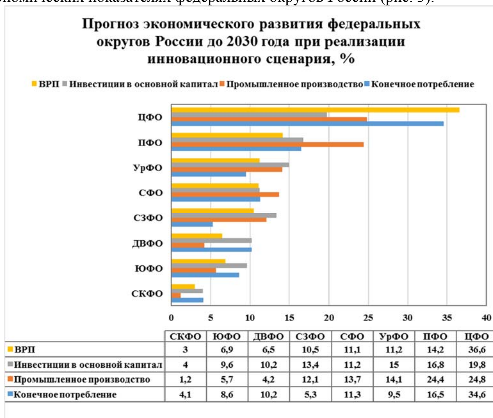
Рис. 3. Прогноз экономического развития федеральных округов России до 2030 г. при реализации инновационного сценария, % [11]

повышению их инновационной активности в регионах, что отразится на макроэкономических показателях федеральных округов России (рис. 3).