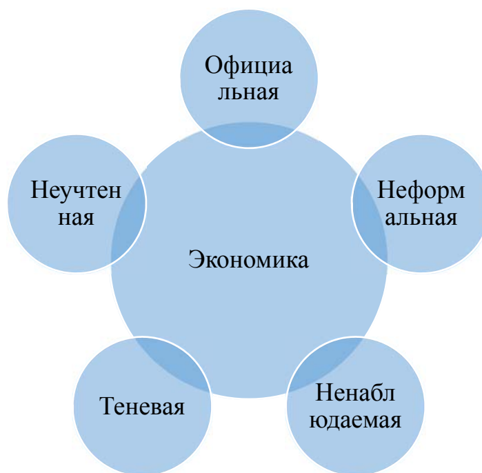
Рис. 1. Теневая экономика как составляющая экономической деятельности, осуществляемой в стране

Чаще всего выделяют следующие составляющие теневой экономики.