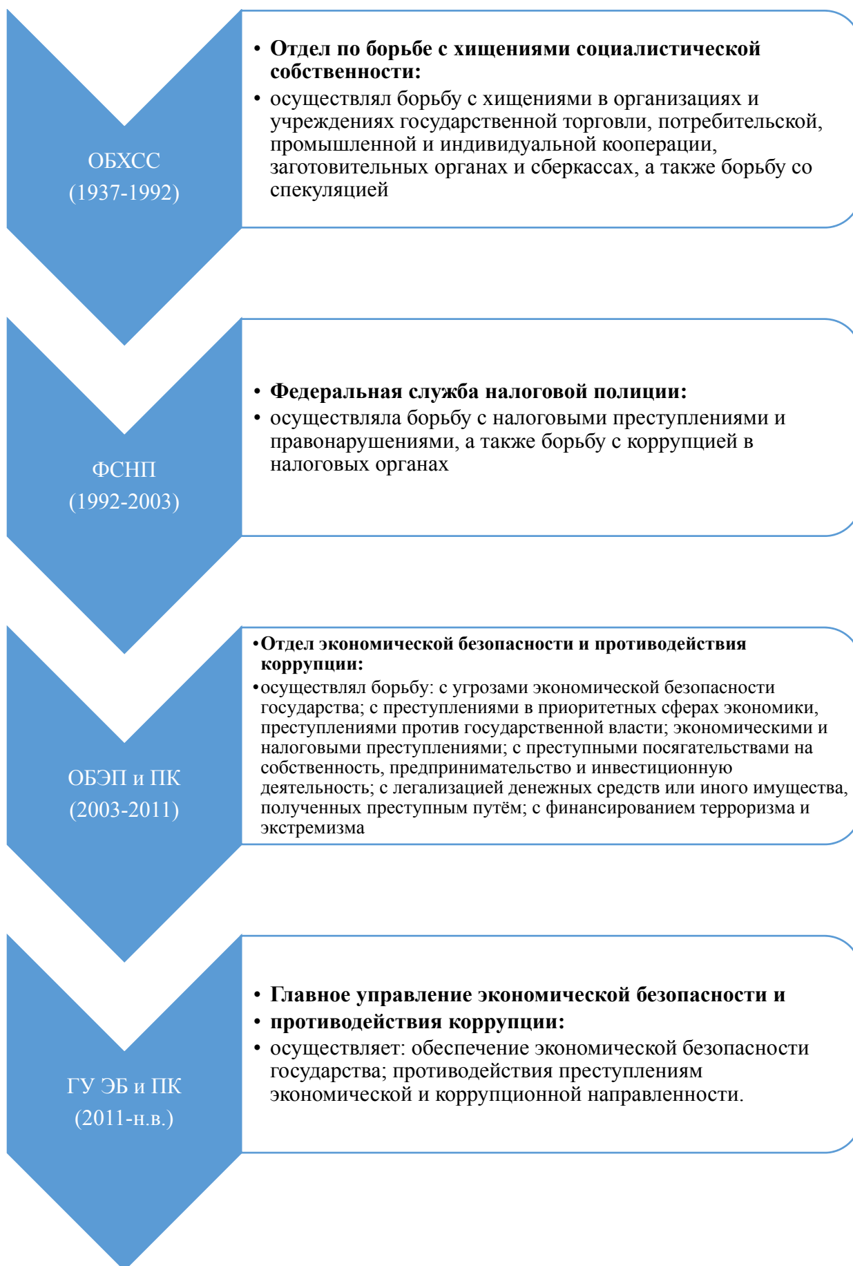
Рис. 2. Структуры по борьбе с теневой экономикой в советский и постсоветский период развития России