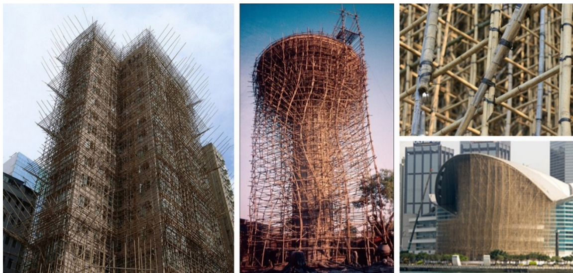
Рис. 1. Строительные леса из бамбука с различными формами

качестве строительного материала имеет много общего с применением стальных элементов. Поскольку в области применения стальных конструкций в строительстве наблюдаются высокие достижения, то применение схожих принципов в возведении современной архитектуры из бамбука является наиболее эффективным способом её прогрессивного роста. Ведь даже на самом раннем этапе своего развития строительство с применением стальных конструкций оказывало огромное влияние на произведения деревянного зодчества [3].