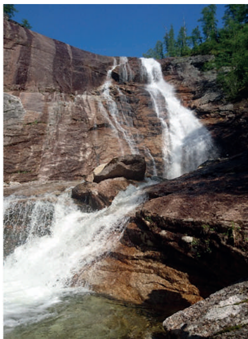
Рис. 7 – Водопад Медвежий

Снежный покров залегает 170–210 дней в году [9]. В течение всего летнего периода на маршруте встречаются снежники-перелетки (рис.8). Погода горных территорий может быть довольно непредсказуема: климатические характеристики гольцевого пояса отличаются от данных ближайшей метеостанции, расположенной в бореально-лесном поясе. Частые туманы в горах препятствуют регулярности вертолётных вылетов (некоторые группы могут ждать заброски к лагерю несколько дней). Особенности климатических условий предъявляют