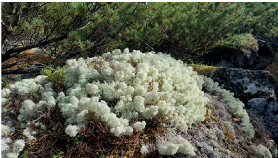
Рис. 9 – Лишайники вдоль туристической тропы

В подгольцовом поясе на склонах и кумулах широко распространены различные виды мхов и лишайников, в том числе кладония звездчатая, кладония оленья и др. (рис. 9). Участки с покровом из лишайников и мхов деградируют наиболее быстро и больше всего подвержены вытаптыванию, при этом уничтоженный лишайниковый покров восстанавливается довольно длительный период. При планировании приключенческих туров должна учитываться рекреационная ёмкость ландшафта с целью регулирования нагрузки и контроля воздействия на природный комплекс. Годовая предельно допустимая нагрузка на территорию маршрутов заповедника составляет 168 чел., при этом рекомендованное число туристов в группе – 20 чел. Во избежание излишнего вытаптывания растительного покрова при движении группы очень важно придерживаться обозначенных маршрутов.