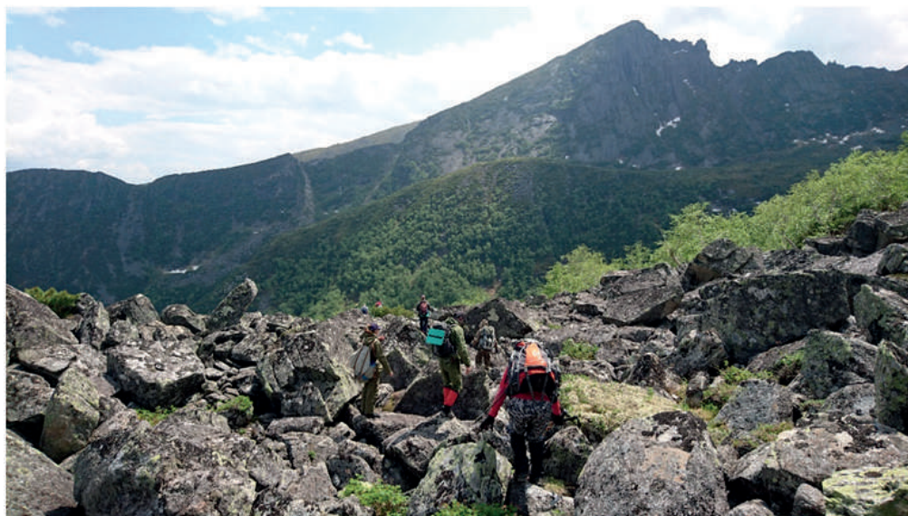
Рис. 4 – Курумные осыпи на пути к оз. Вороны перья

Fig. 3 – Lake Voronyi Pera (left) and Lake Gornoe