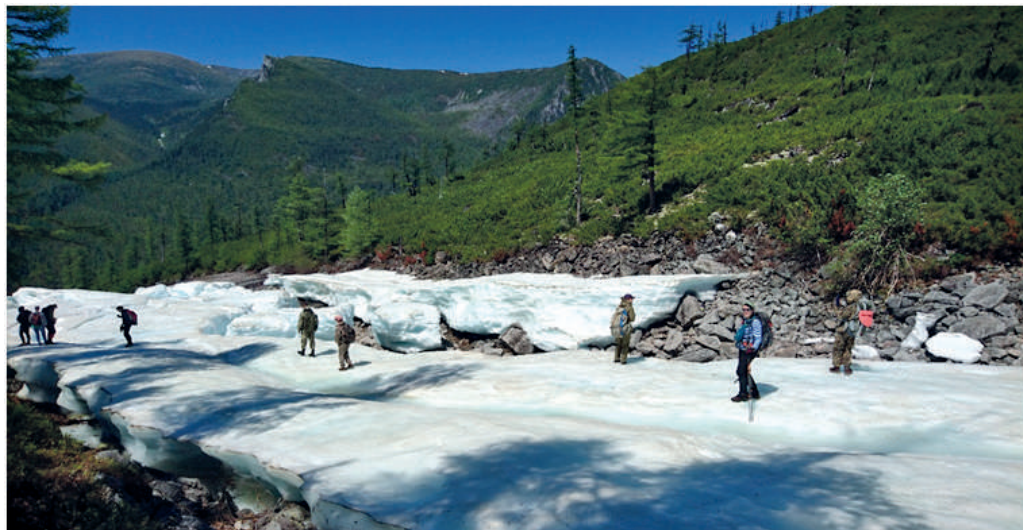
Рис. 8 – Снежник на пути к водопаду Медвежьему

специфические требования к одежде и экипировке туристов, так, например, рекомендуемая температура комфорта спального мешка должна быть не менее +5 °С).