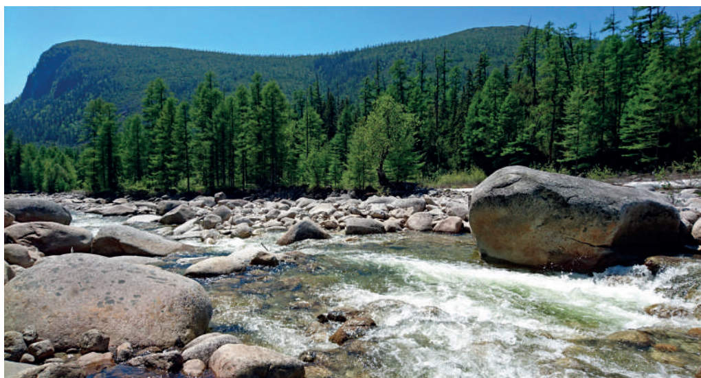
Рис. 6 – Река Курайгагна

жьего, а также по труднопроходимым зарослям кедрового стланика. Водопад расположен в 300 метрах от слияния ручья и реки Курайгагна (рис. 6).