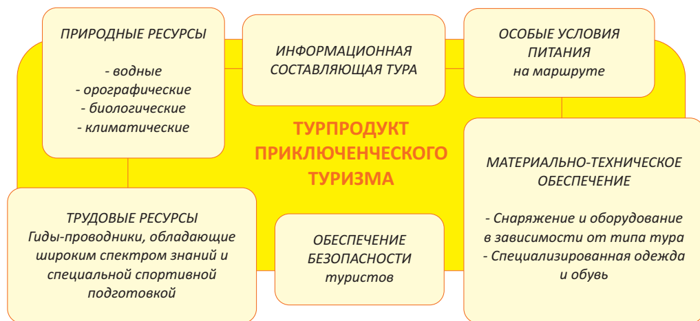
Рис. 1 – Элементы турпродукта в приключенческом туре

Всемирная туристская организация подразделяет приключенческий туризм на две крупные категории: так называемый «мягкий» приключенческий туризм («soft adventure») – включающий некатегорийные маршруты для туристов без какой-либо специальной подготовки, и «жесткий» туризм («hard adventure»), к которому можно отнести экстремальный и спортивный туризм. Всего АТТА выделяет 34 направления приключенческого туризма в зависимости от уровня активности и экстремальности, способа передвижения на маршруте и т.д. [12]. Туристский продукт в