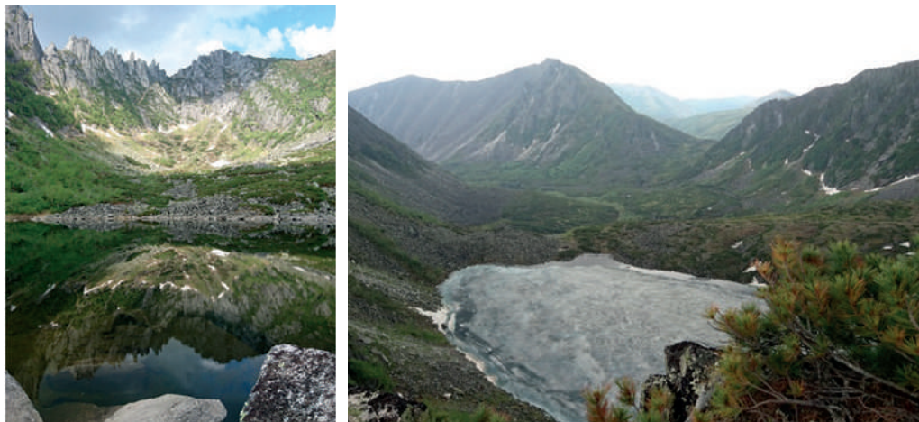
Рис. 3 – Озеро Вороны Перья (слева) и оз. Горное

площадку к оз. Горное и к оз. Вороны перья (рис. 2). Тропы к ледниковым озёрам проходят преимущественно по курумным осыпям, подъем по которым может быть сложен и зачастую опасен из-за большого количества «живых» камней (рис. 3). Для подготовленных туристов (спортсменов, альпинистов) есть возможность совершить восхождение на пик «Неприступный», одну из высочайших вершин хребта Дуссе-Алинь (высота 2078 м над у.м.).