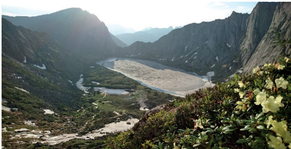
Рис. 5 – Озеро Медвежье, на переднем плане – рододендрон золотистый

С трёх сторон озеро опоясывают неприступные скальные отвесы высотой более 300-400 метров. Даже в июле озеро ещё может быть покрыто льдом (рис. 5). Базовая стоянка на территории заповедника расположена на оз. Долгое, которое находится в соседней долине ниже оз. Медвежьего.