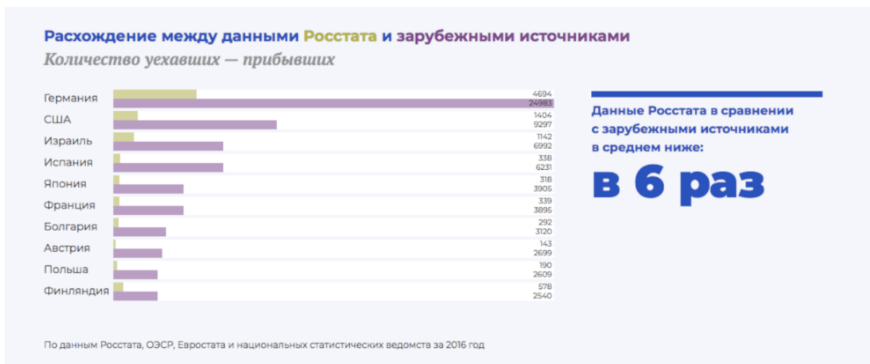
Рис. 3. Расхождение между данными Росстата и зарубежными источниками по числу уехавших и прибывших россиян

Согласно данным ООН, Россия находится на третьем месте в мире по числу «потерь» своих граждан из-за эмиграции. По состоянию на 2017 г., в мире проживало 10,6 млн чел., покинувших Россию. Больше покинуло свою страну только жителей Индии (16,6 млн чел.) и Мексики (12,9 млн чел.) [11]. По числу эмигрантов Россия опережает даже Китай (9,9 млн чел.). Но населения в Китае на порядок больше, чем в России (примерно 1,4 млрд чел. на 2017 г.). Так что 7% эмигрантов от всего населения России или примерно 4% от общего числа эмигрантов из всех стран мира [11] – это огромная цифра.