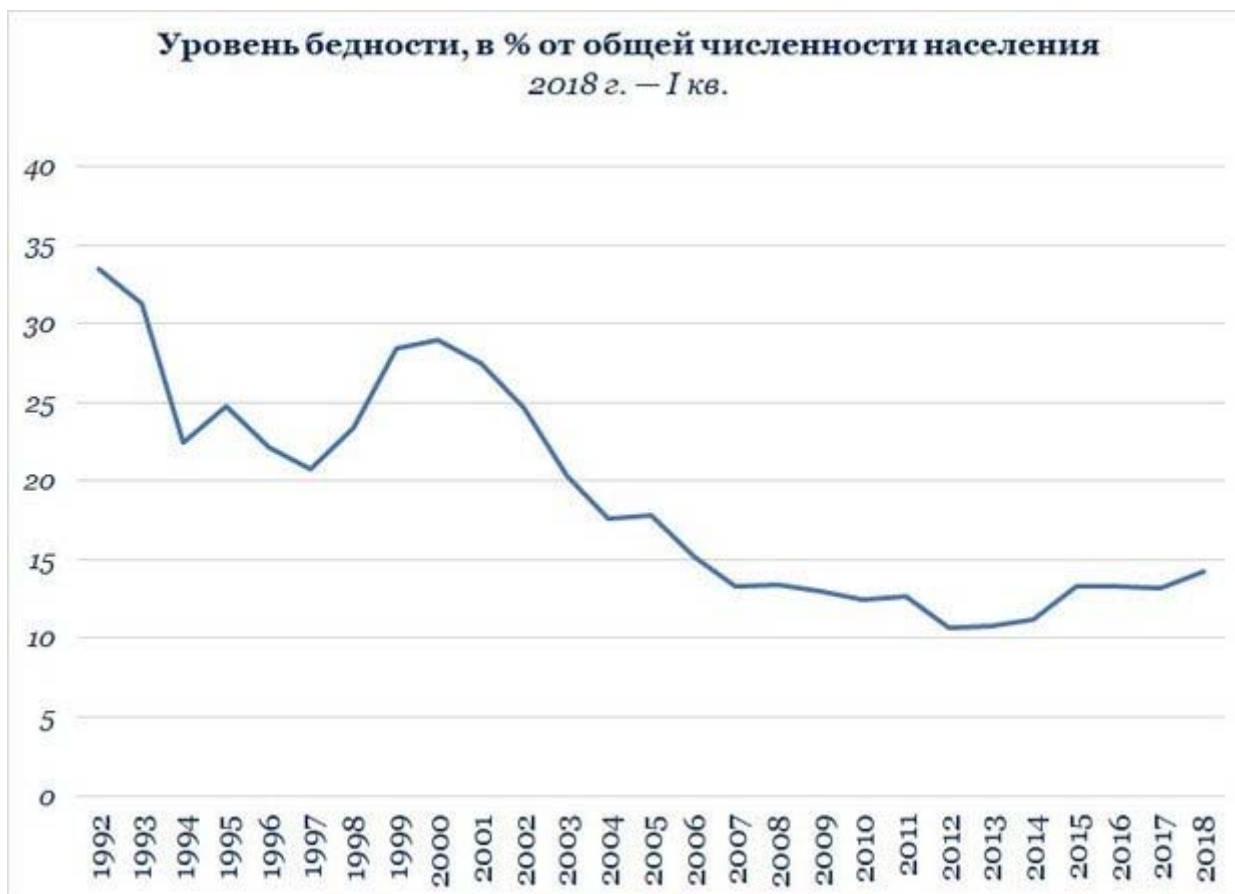
Рис. 2. Динамика уровня бедности в Российской Федерации

Опора же на потребительскую корзину, определяющую сегодня прожиточным минимумом, как на мерило уровня бедности, дает оценку, по сути, только в части возможностей граждан нормально питаться.