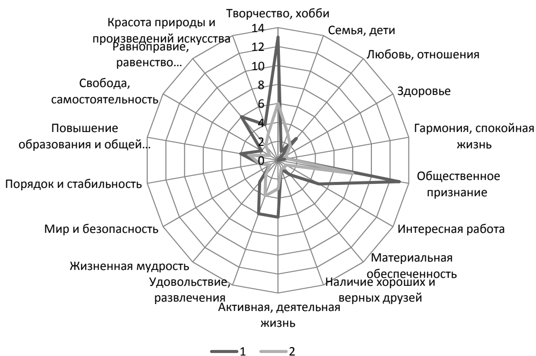
Рис. 2. Распределение ответов респондентов на вопрос: «Оцените, пожалуйста, каждый пункт с точки зрения его значимости в Вашей жизни», % от числа ответивших «совсем не важно» – (1) и «не важно» (2), 2018, ФИЦКИА РАН

Комментарий эксперта – преподавателя в университете 1 :