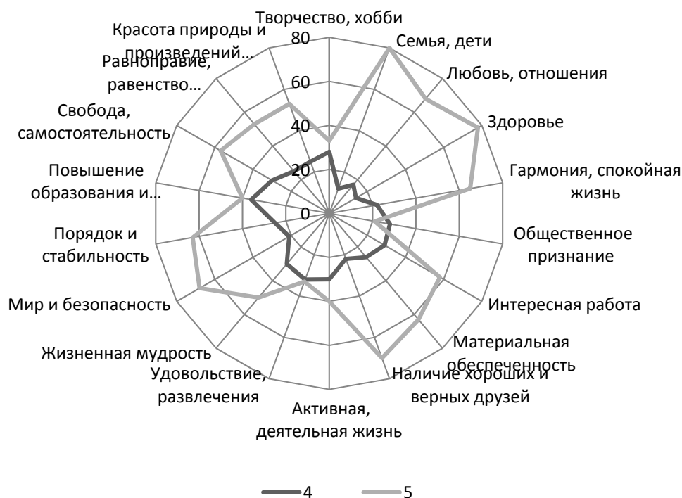
Рис. 1. Распределение ответов респондентов на вопрос: «Оцените, пожалуйста, каждый пункт с точки зрения его значимости в Вашей жизни», % от числа ответивших «очень важно» – (5) и «важно» – (4) 2018, ФИЦКИА РАН

Наименее популярны такие терминальные ценности как: общественное признание, творчество, хобби, удовольствие, развлечения, повышение образования и общей культуры (рис. 1).