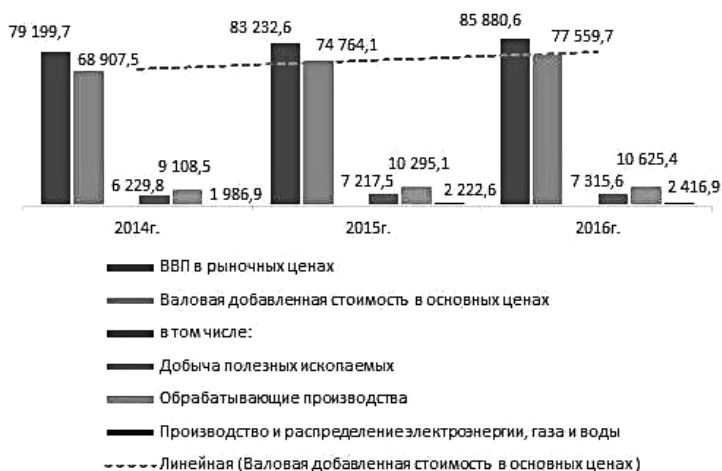
Рис. 3. Валовая добавленная стоимость по видам экономической деятельности (в текущих ценах, млрд руб.) 1

Сферой применения ОКДП являются ведомства, организации и предприятия всех форм собственности, функционирующие на внутреннем рынке. ОКДП обеспечивает информационную поддержку решения следующих задач: