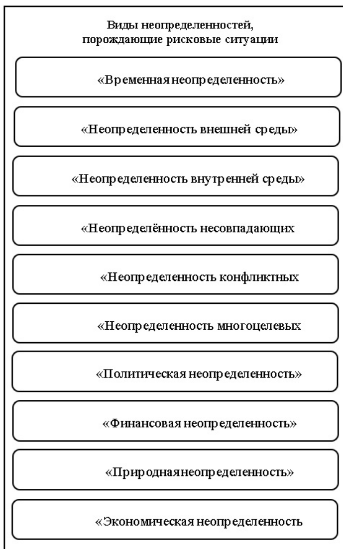
Рис. 2. Виды неопределенностей, порождающие рискованные ситуации, анализ которых рассматривается в рамках учебной дисциплины «Теория риска»

В рамках учебной дисциплины «Теория риска» рассматриваются различные виды неопределенностей, представленные на рис. 2.