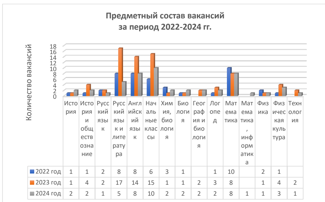
Рис. 1. Предметный состав вакансий за период 2022-2024 гг.

В сумме 54% вакансий было по выделенным предметам. Для наглядности представим данные на общей диаграмме на рис. 1.