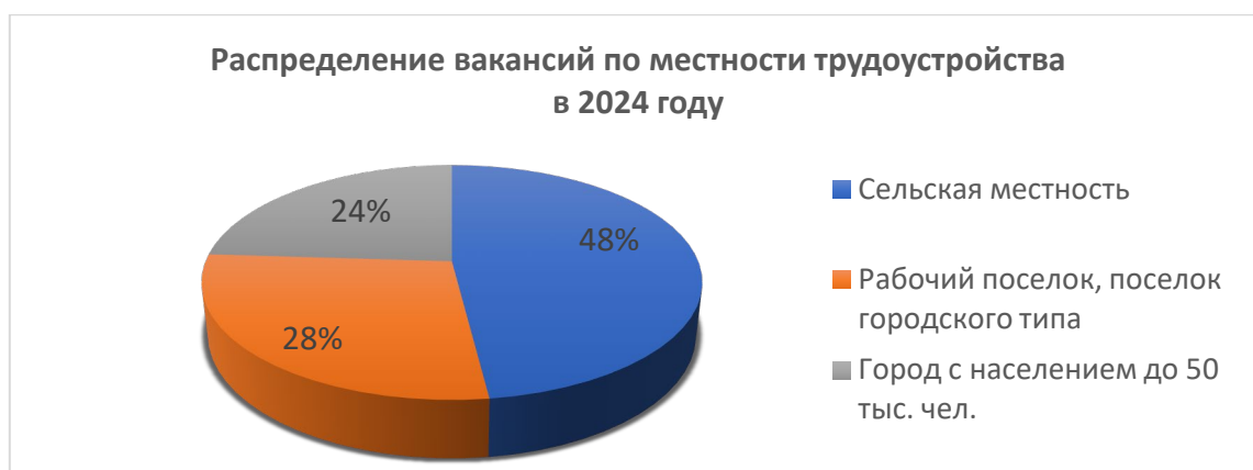
Рис. 2. Распределение вакансий по местности трудоустройства в 2024 г.

Практически половина вакансий приходится на школы, расположенные в сельской местности. Школы в поселках и в городах с населением до 50 тыс. чел. имеют примерно одинаковое соотношение вакантных мест.