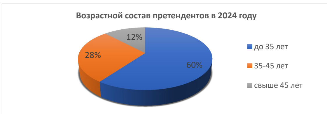
Рис. 5. Возрастной состав претендентов в 2024 г.

Для сравнения по стране процент молодых специалистов в 2024 г. составил порядка 44,6% от общего числа педагогов [4, с. 25], т.е. в нашем регионе доля молодых учителей в прошлом году была значительно выше. Наибольшее число претендентов в возрастной категории до 35 лет включительно может быть обусловлено наличием определенных