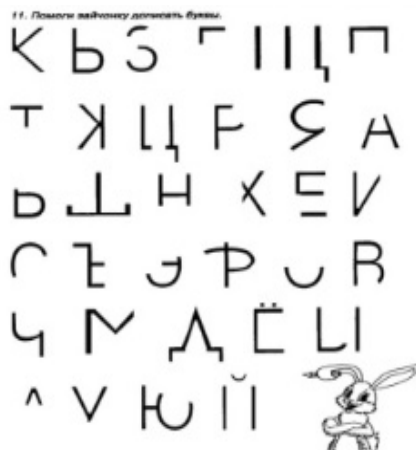
Рис. 2. «Определи букву и допиши недостающие элементы»

Опыт работы показал, что полезны задания, усложняющие узнавания букв, это – «Перечёркнутые буквы», «Разный шрифт», «Перевёрнутые буквы», «Сколько одинаковых букв?», «Каких букв больше?», «Наложенные буквы», «Зеркальные буквы», «Найди нужную букву среди перечёркнутых букв» [5].