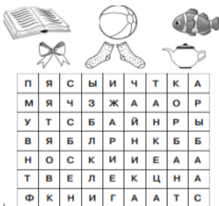
Рис. 5. «Найди и обведи слова»

6) Ученики находят и обводят по вертикали и горизонтали слова, обозначающие нарисованные предметы.