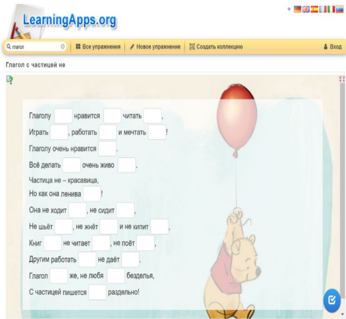
Рис. 2. Пример задания на отработку глаголов с частицей – НЕ: (взято с сайта https://learningapps.org/18012959 )

Другим примером задания на сайте ресурса Learningapps является задание на отработку глаголов с частицей – НЕ, употребляющейся с глаголами несовершенного вида (см. рис. 2).