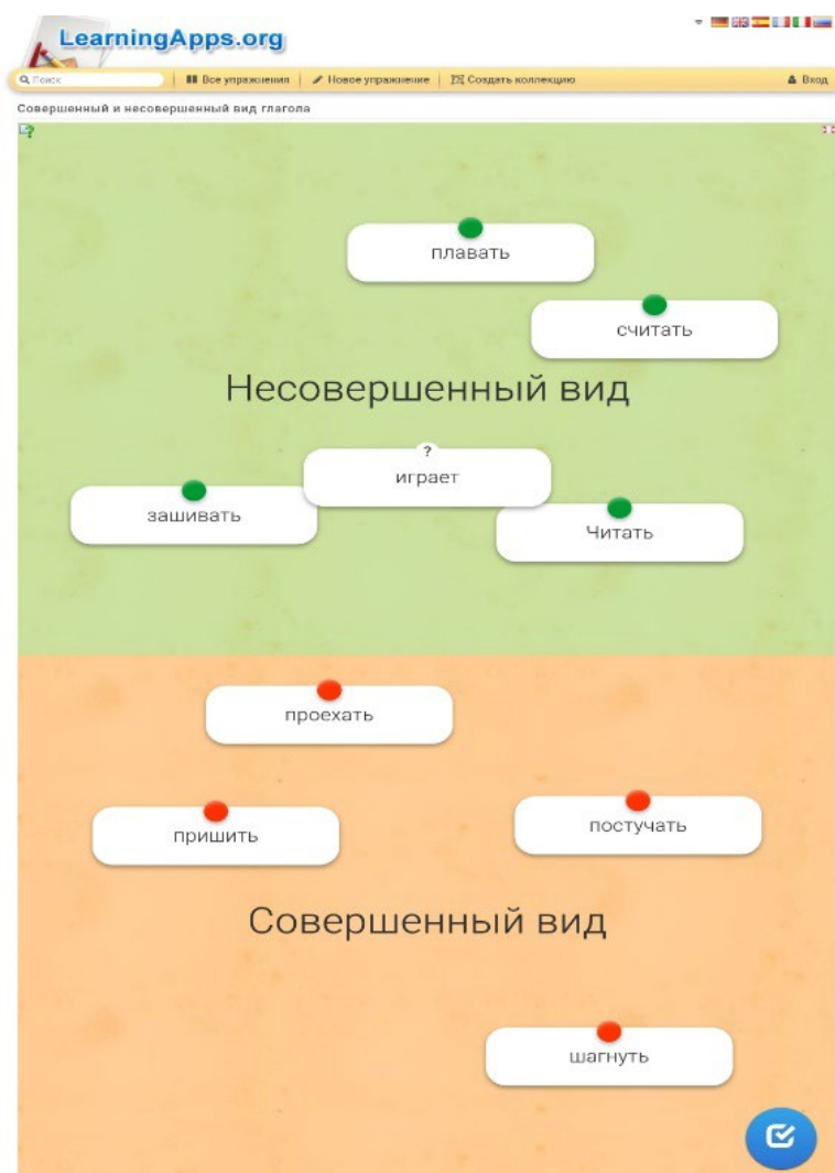
Рис. 1. Пример задания на виды глагола на сайте Learningapps.org

Так, например, на сайте Learningapps.org эффективным является задание под названием «Виды глаголов: процесс или результат?». Особенностью применения данного задания явилось то, что оно позволило преподавателю услышать каждого студента или увидеть, как хорошо понимает тему иностранный учащийся. Задачей студентов было выбрать правильные варианты ответов на вопросы, предложенные в задании (см. рис. 1).