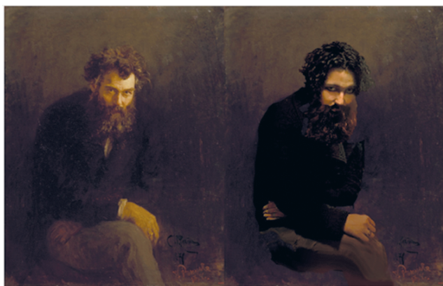
Рис. 10. И.Е. Репин «Портрет Ивана Шишкина». Косплей — Е. Михайлова

портретный образ, преобладает над внешними чертами изображаемого человека, и именно это должно быть главенствующим и в моей работе. До выбора картины я уже знала, что хочу что-нибудь необычное — не стереотипный, не типичный образ. Мой взгляд сразу упал на портрет Шишкина. Меня тронул этот пронзительный взгляд. Кроме того, у меня кудрявые волосы, и я сразу увидела себя в образе Шишкина. Возникла идея применить фактуру своих волос в изображении бороды художника. Детали образа подбирала недолго. У меня была похожая одежда. Сделав фото, я совершила фотоманипуляции, подобрав подходящий цветовой тон. Отредактировала бороду из собственных волос. Фон взят с оригинала» (Елизавета Михайлова).