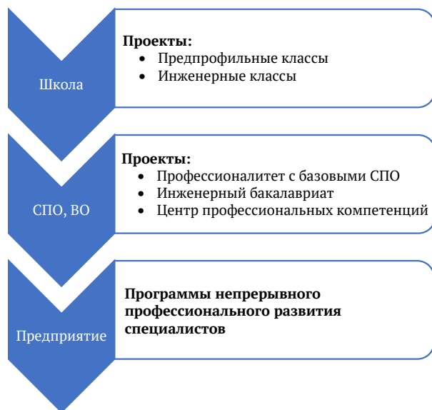
Рис. 1. Модель непрерывного профессионального развития специалистов