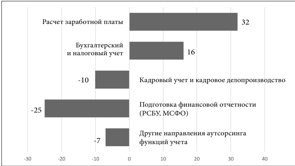
Рис. 3. Темпы роста выручки участников рэнкинга по направлениям аутсорсинга учетных функций в 2023 году (%)