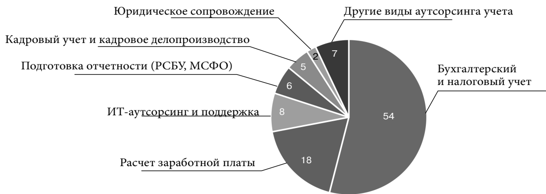
Рис. 2. Структура доходов крупнейших аутсорсинг-провайдеров по итогам 2023 года (доля, %)