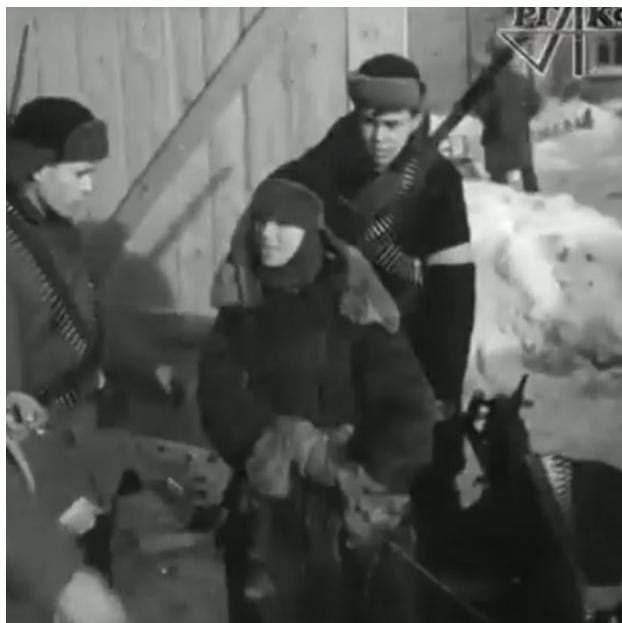
Фото 4. Кадр из кинохроники ТАСС «В Курске» Кинооператор Ф. Леонтович. - февраль 1943 г. Илья 15 лет

Из письма В.Е. Шарову: В ночь на 8 февраля 1943 г. Курск после долгой оккупации (со 2 ноября 1941 г.) снова стал советским. В эту же ночь вышли из подполья и объединились в партизанские отряды молодежные подпольные группы. Таких добровольных молодежных подпольных групп в Курске в период оккупации было немало.