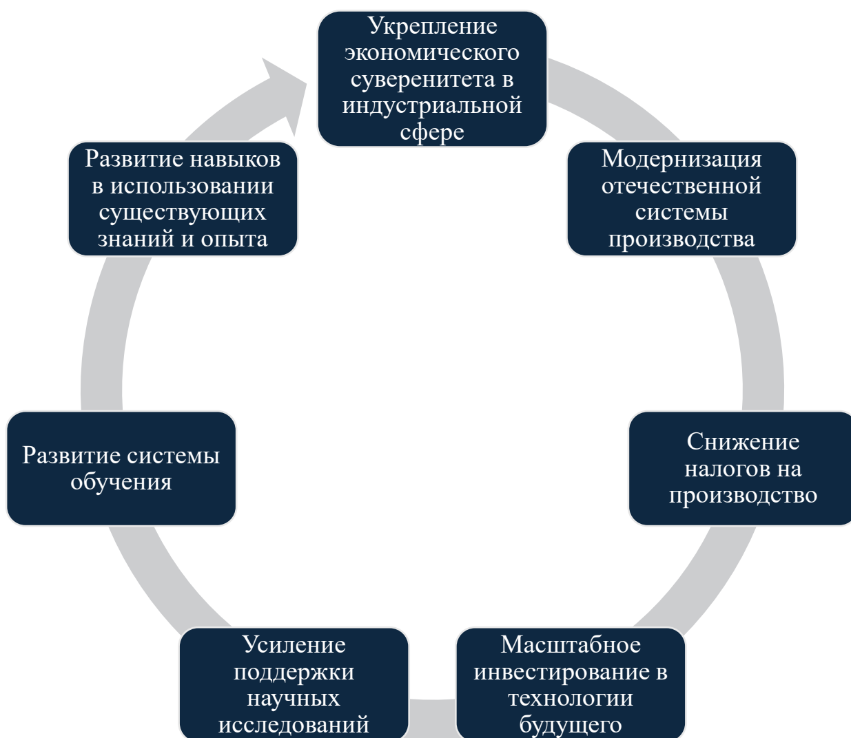
Рис. 5. Комплекс мер, направленных на укрепление экономического суверенитета Франции в индустриальной сфере

В качестве основного фактора успешной реиндустриализации Франции эксперты считают создание в стране благоприятной предпринимательской среды, а также реализацию комплекса мер, направленных на укрепление экономического суверенитета в индустриальной сфере (рис. 5).