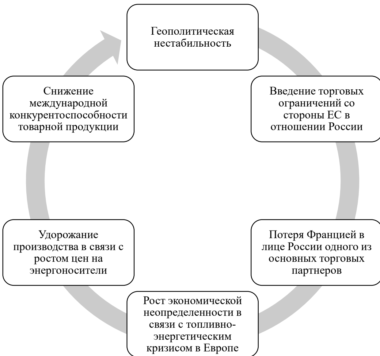
Рис. 4. Влияние геополитической нестабильности на развитие экономики Франции

социально-психологического свойства. Среди них: иждивенческие настроения части французского общества и недоверие к инновациям.