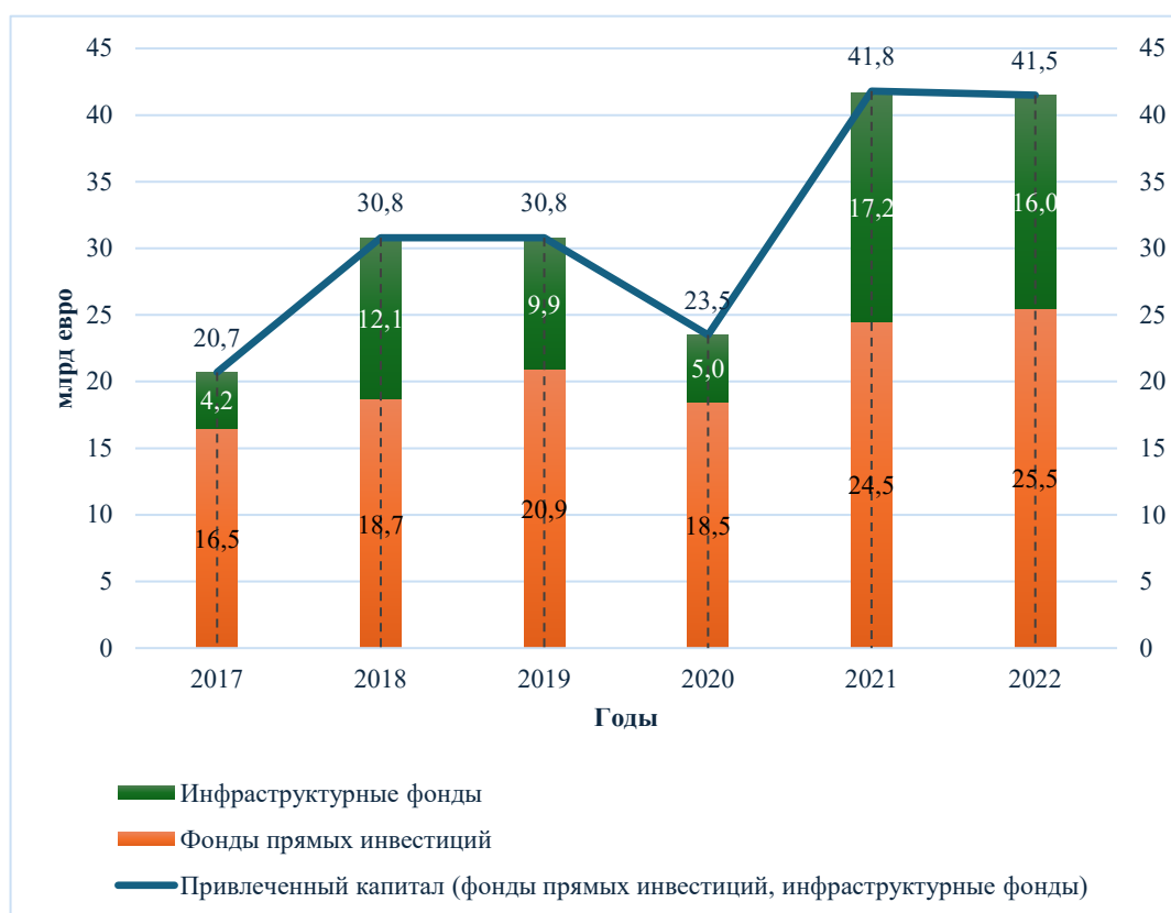
Рис. 2. Структура источников привлечения капитала во французскую экономику.

отметить резкое снижение в 2020 г. почти на 12% по сравнению с годом ранее, что также связано с влиянием пандемии Covid-19.