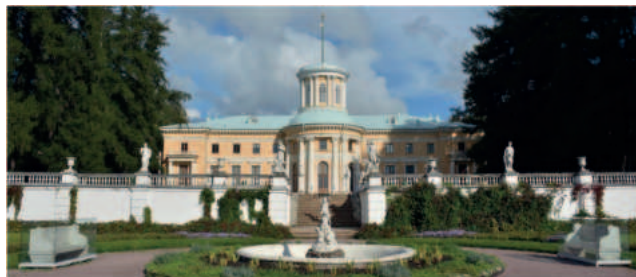
Рис. 3. Музей усадьба «Архангельское», современное фото

Концепцией этого исторического места стал уникальный живописный природный сад с собранием живописи, графики, скульптуры и предметов декоративного искусства.