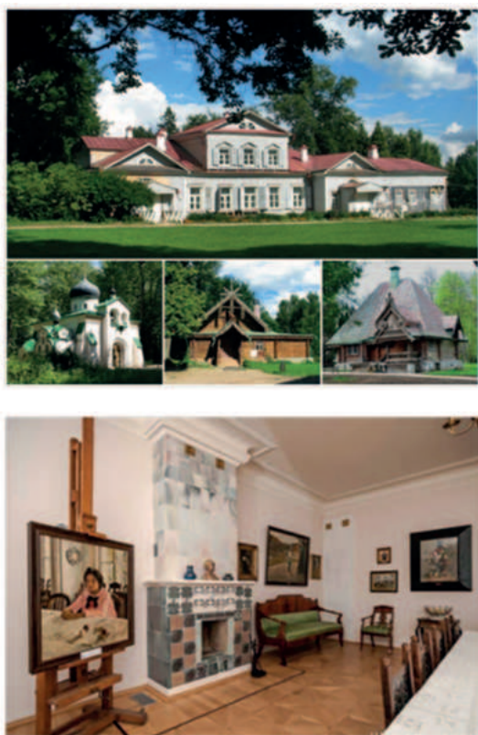
Рис. 2. Архитектурные достопримечательности и музейные комнаты усадьбы «Абрамцево»

драматургов. Уникальность такой продолжительной жизни русской усадьбы, сохранившей до наших дней свой функционал и систему развития, состоит в её социокультурном планировании. Основа планирования по принципу симметрии заложена во многих мировых и отечественных музеях-заповедниках и памятниках архитектуры. Сложнее с аналогами «Абрамцево», в системе которого заложена основа мелкопоместной дворянской усадьбы (рис. 2) [11; 13].