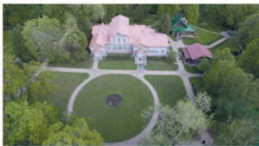
Рис. 1. Музей усадьба «Абрамцево», панорама, современное фото

По результатам анализа исторических документов и истории возникновения архитектуры русской усадьбы, выделена концепция, явившаяся основой создания архитектурно — парковых ансамблей. Эта концепция рассматривалась на примере памятника архитектуры, музея заповедника усадьбы «Абрамцево» (рис. 1).