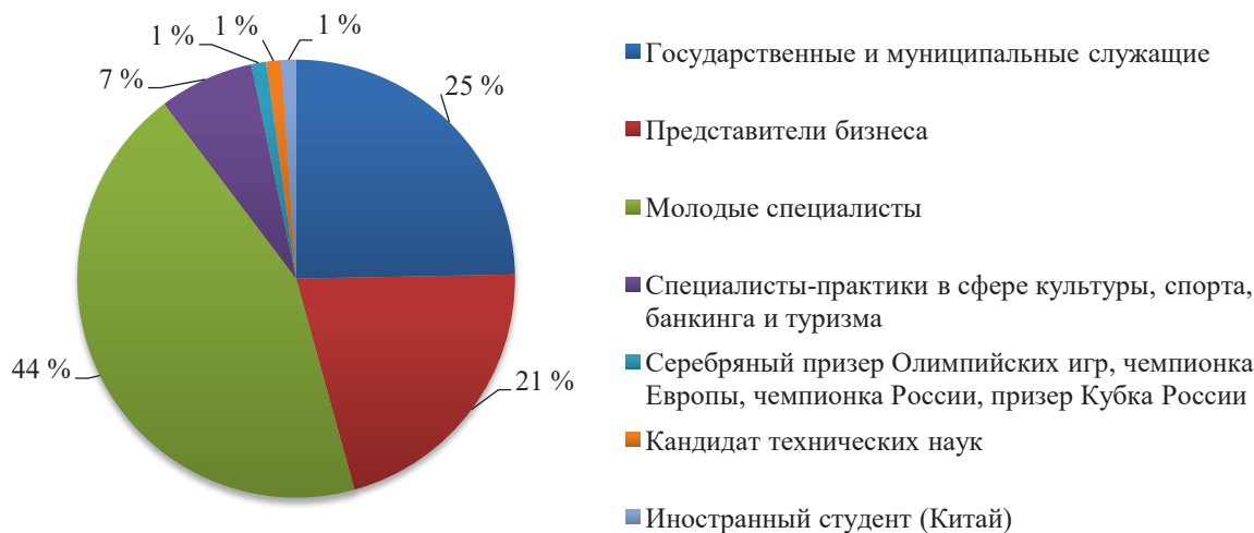
Рис. 3. Структура состава магистрантов-стратегов, обучающихся на магистерской программе «Экономическая и финансовая стратегия» в Кемеровском государственном университете, по состоянию на 01.12.2023 г.