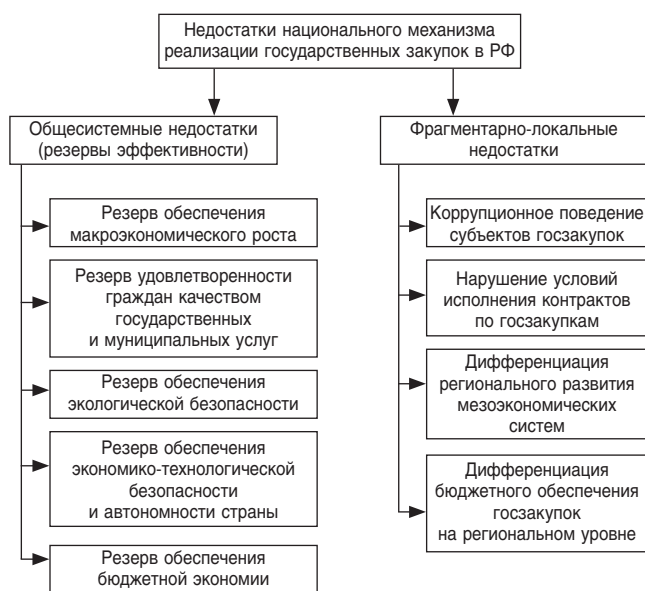
Рис. 1. Недостатки действующего российского механизма государственных закупок

На основании результатов анализа эффективности государственных закупок в Российской Федерации в 2013–2022 гг. были систематизированы основные недостатки созданного и используемого механизма реализации госзакупочной деятельности (рис. 1).