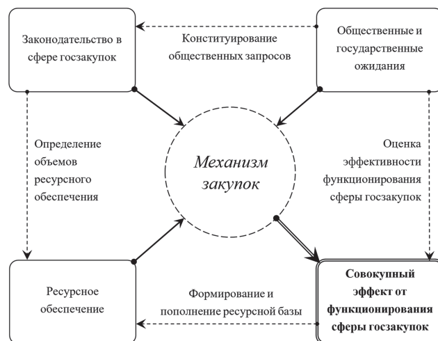
Рис. 2. Схема воздействия рамочных ограничений на функционирование механизма госзакупок

сфере госзакупок, создание материальной и информационно-коммуникативной базы обеспечения функционирования механизма госзакупок.