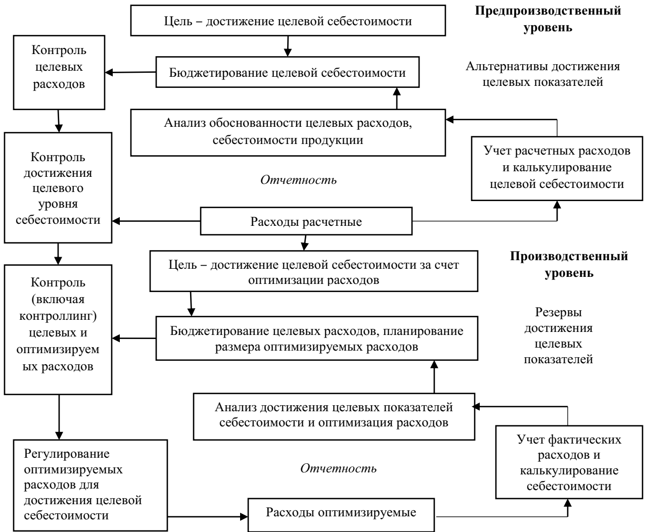
Рис. 2 Модель производственного учета на основе концепции устойчивого развития Составлено авторами.

Таким образом, в условиях отсутствия типовых стандартов и конкретных рекомендаций по подготовке и аудиту стратегической бизнес-отчетности, в том числе в области устойчивого развития, рассмотрение существующих подходов к разработке подобного инструментария представляется полезным для науки и практики учетной и аудиторской деятельности. Альтернативный подход рассмотрен нами на примере электронной промышленности как одной из приоритетных отраслей российской экономики, имеющей свою стратегию и обладающей специфическими особенностями и бизнес-рисками. Проведенный отраслевой анализ текущего состояния электронной промышленности в условиях санкций