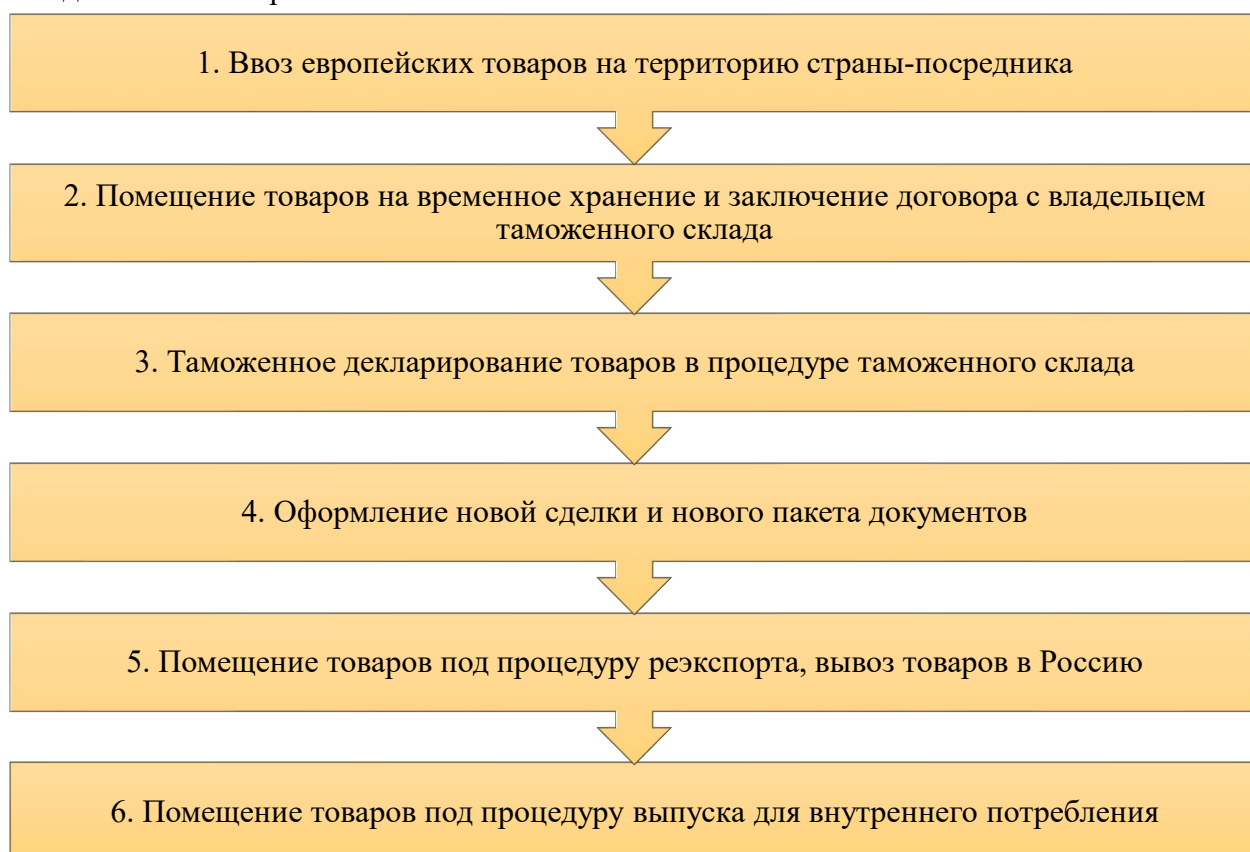
Рис. 1. Логистическая схема поставки европейских товаров на российский рынок через страны, которые не являются членами ЕАЭС, с применением процедуры таможенного склада

Логистическая схема поставки европейских товаров на российский рынок через страны, которые не являются членами ЕАЭС, с применением процедуры таможенного склада показана на рис. 1.