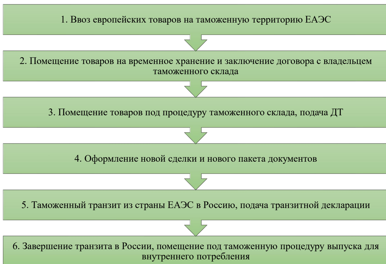
Рис. 2. Логистическая схема поставки европейских товаров на российский рынок через страны ЕАЭС с применением процедуры таможенного склада

На первом этапе европейские товары ввозятся на таможенную территорию ЕАЭС (например, из ЕС в Беларусь автомобильным транспортом либо из Китая в Казахстан железнодорожным транспортом). При прибытии товаров железнодорожным транспортом перевозчик предоставляет таможенному органу накладную ЦИМ или СМГС, передаточную ведомость, вагонную ведомость, инвойс, упаковочный лист и др.