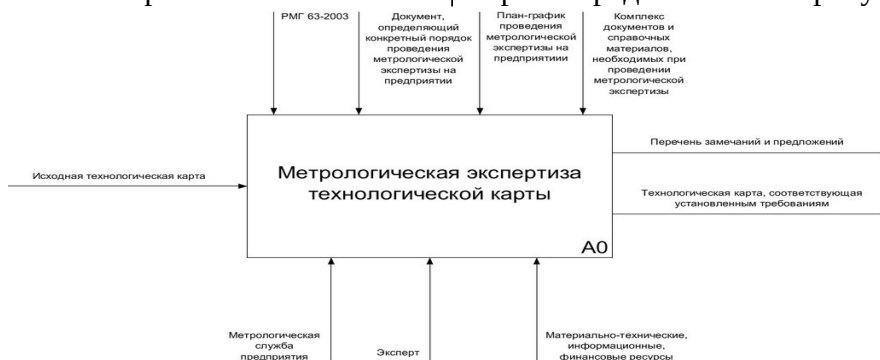
Рис. 1. Информационная модель подпроцесса «Метрологическая экспертиза технологической карты» Fig. 1. Information model of the subprocess "Metrological examination of the technological map"

документации». Подпроцесс «Метрологическая экспертиза технологической карты», в свою очередь, декомпозируется на следующие виды деятельности: оценивание рациональности номенклатуры измеряемых параметров; оценивание соответствия действительной точности измерений заданным требованиям; оценивание рациональности выбранных средств измерений и методик выполнения измерений; контроль метрологических терминов, наименований измеряемых величин и обозначений их единиц. Информационная и функциональная модели подпроцесса «Метрологическая экспертиза технологической карты» представлены на рисунках 1 и 2.