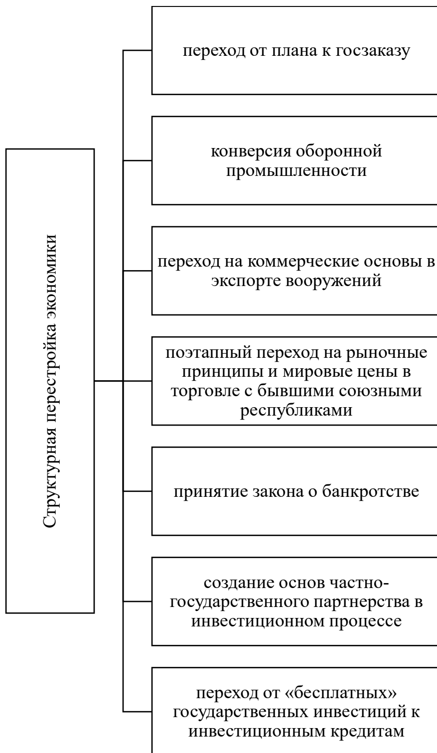
Рис. 3. Состав основных мероприятий блока гайдаровских реформ «структурная перестройка экономики»

Во-первых, во многом был утрачен потенциал Госплана СССР. Во всяком случае его преемник Минэкономразвития решает проблемы планирования менее эффективно [25-27].