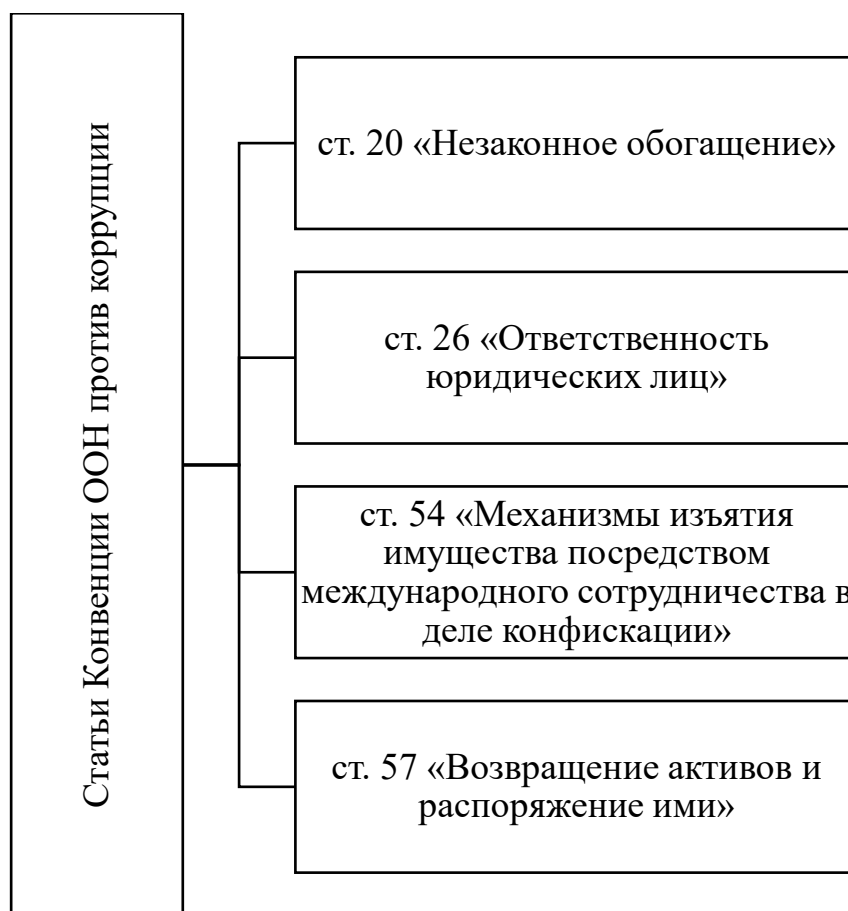
Рис. 5. Статьи Конвенция ООН против коррупции (UNCAC) не ратифицированные Российской Федерацией в рамках Федерального закона от 8 марта 2006 г. N 40-ФЗ [39]

Анализируя мероприятия по конверсии оборонной промышленности, реализуемые в рамках гайдаровских реформ (рис. 3), необходимо отметить, что это была реализация правительству Гайдара Е. заказа западных консультантов на отказ страны от высоких технологий производства в пользу примитивного производства ширпотреба, что привело: