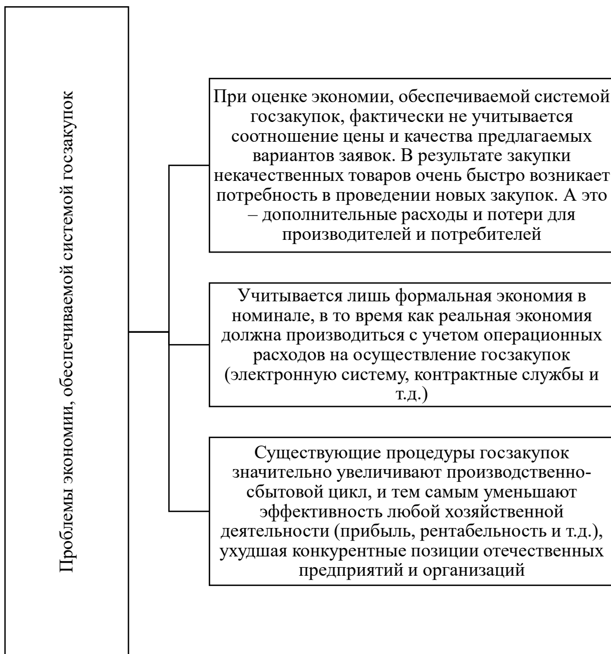
Рис. 6. Ключевые проблемы процедур госзакупок, реализуемых в отечественной экономике [2]

Об истинных целях мероприятий по принятию закона о (несостоятельности) банкротстве предприятий [11] в период гайдаровских реформ 1992 г. никто не мог рассказать точнее и красочней ключевого чиновника, осуществлявшего приватизацию предприятий в России в 1990-е годы Анатолия Чубайса, занимавшего с 10 ноября 1991 г. пост председателя Госкомимущества РСФСР (далее Председателя Государственного комитета России по управлению государственным имуществом по 5 ноября 1994 г.): «Что такое приватизация для нормального западного профессора, для какого-нибудь Джеффри Сакса? ... Для него, в соответствии с западными учебниками, это классический экономический процесс, в ходе которого оптимизируются затраты на то, чтобы в максимальной степени эффективно разместить активы, переданные государством в частные руки» [42].