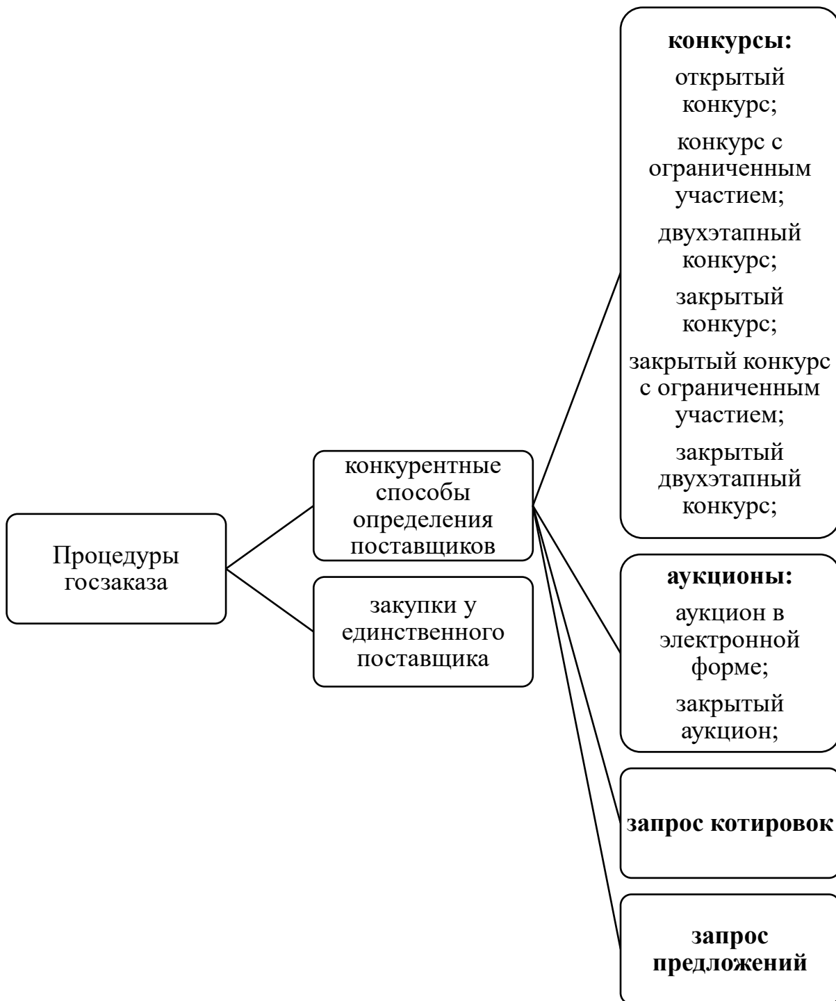
Рис. 4. Классификация законодательно регламентируемых способов госзаказа